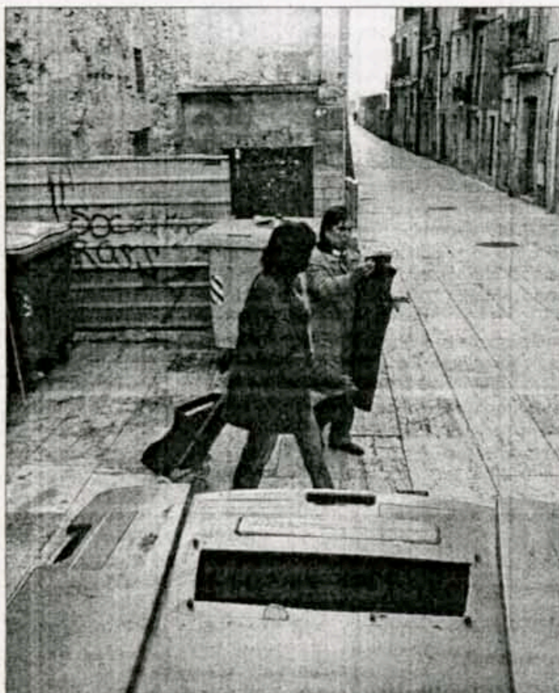
Este tipo de contenedores de basura también desaparecerán de las calles de la Part Alta.

tar las medidas necesarias para evitar la transmisión del virus a otras personas. ■ En las primeras semanas después de la infección la posibilidad de transmisión del virus es muy elevada. En la mayoría de los nuevos casos la infección se adquiere por contacto sexual con una persona que se ha infectado recientemente.